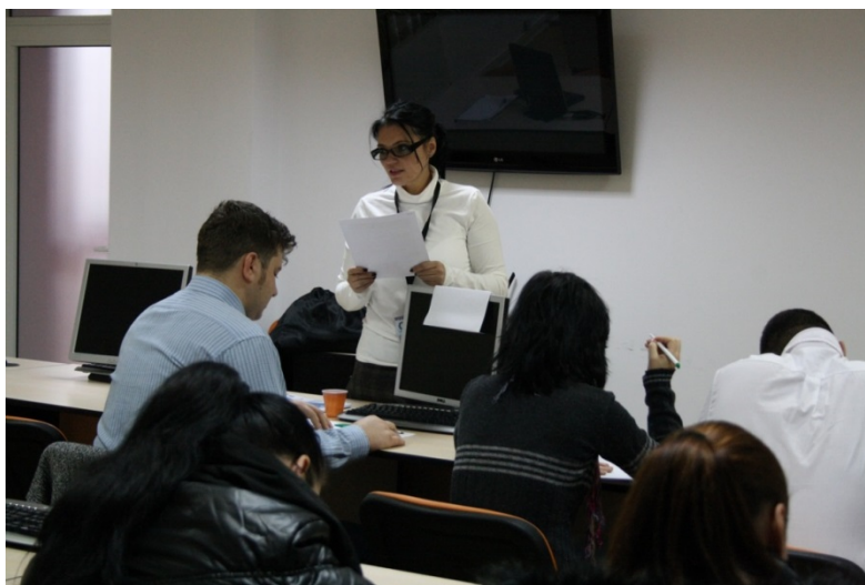
Imagine de la sesiunile de instruire pentru prima grupă